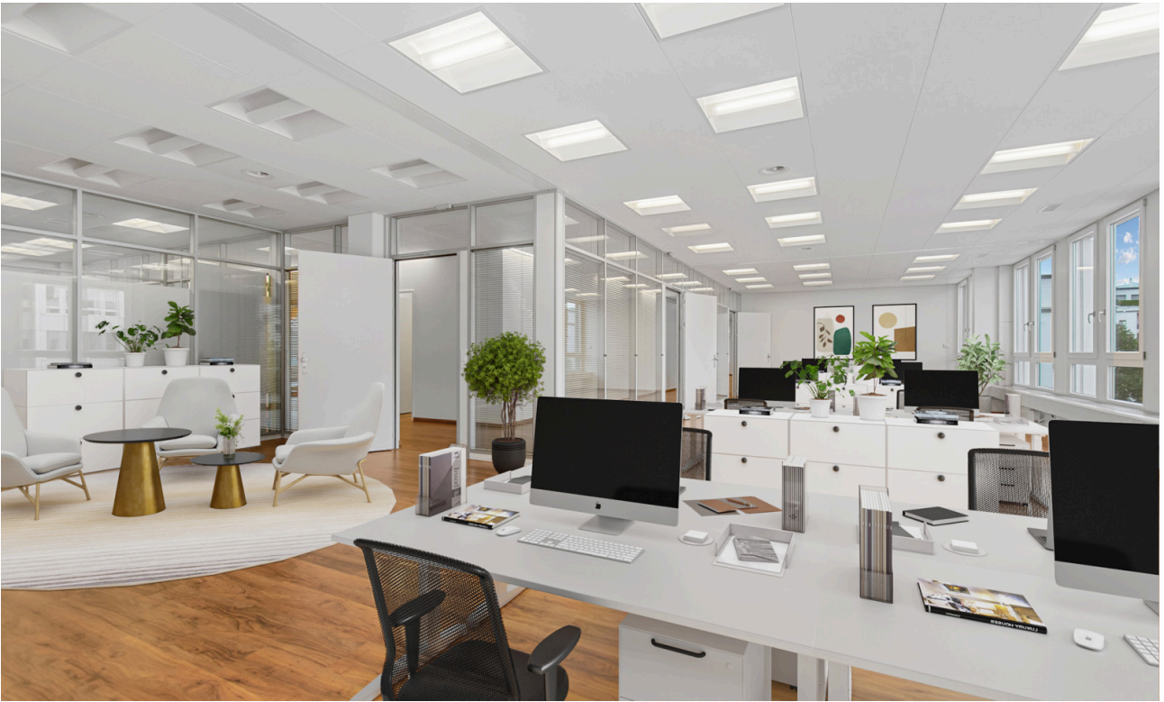
Grossraumbüro - virtuell möbliert