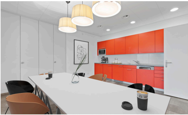
Küche - virtuell möbliert