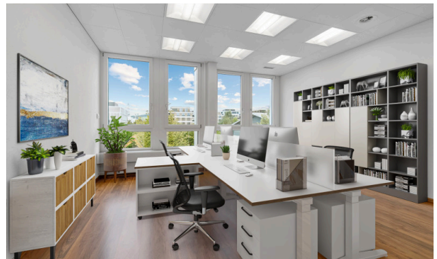
Büro - virtuell möbliert