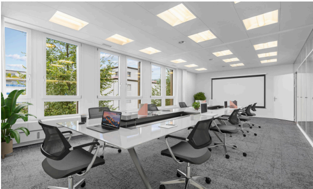
Meetingraum - virtuell möbliert