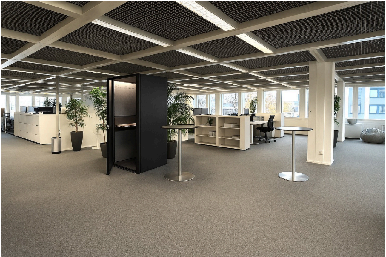
Platz für Ideen