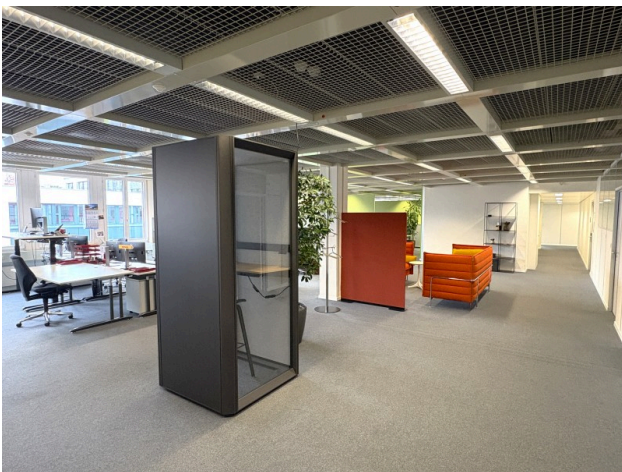
Flexibel unterteilbare Flächen