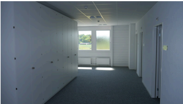
Vorraum mit Aktenschränken