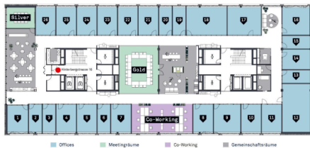
Übersichtsplan - 26 Offices / 2 Meetingräume / 12 Co-Working Arbeitsplätze / ästhetische Gemeinschaftsräume