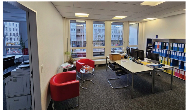
Empfangsbereich mit privater Loggia