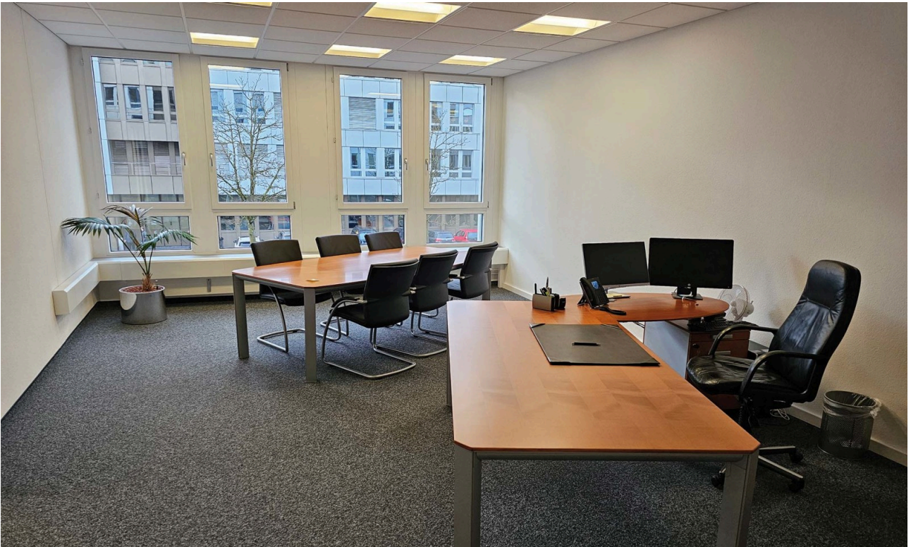
Grosszügiges Büro mit Sitzungstisch