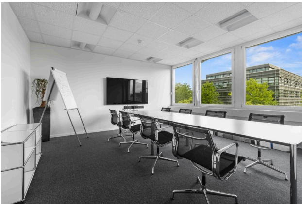
Sitzungszimmer mit professionellem Ambiente