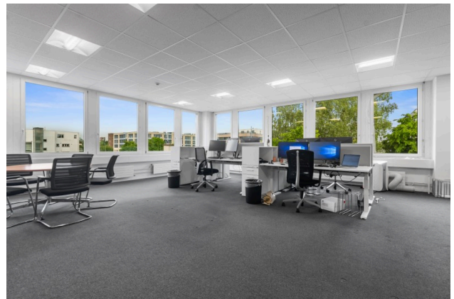
Offener Arbeitsbereich mit guter Belichtung