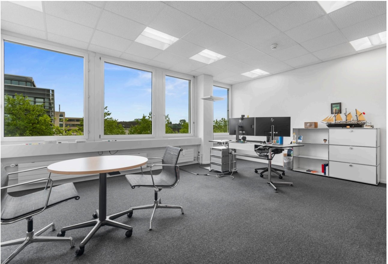
Heller Büroraum für konzentriertes Arbeiten