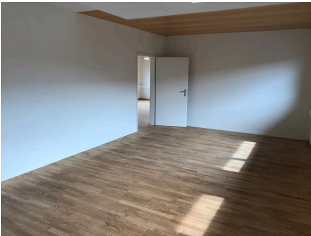
Büro / Sitzungszimmer