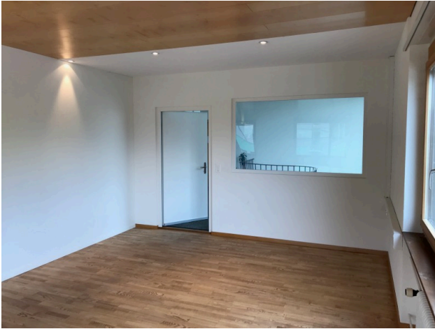
Büro / Sitzungszimmer