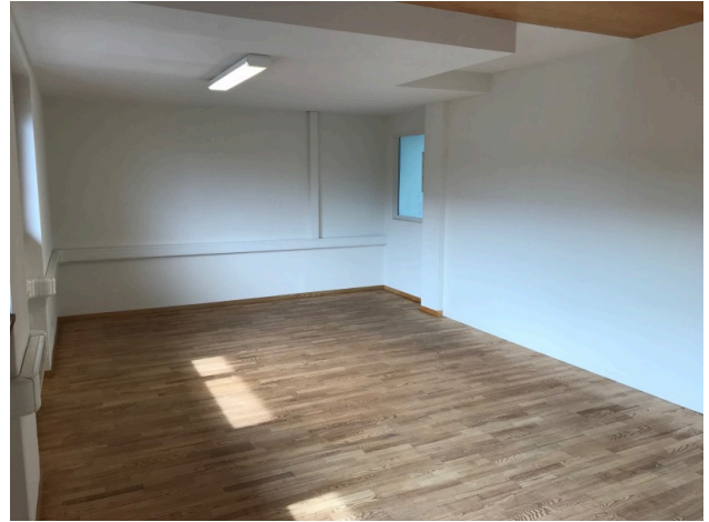
Büro / Sitzungszimmer