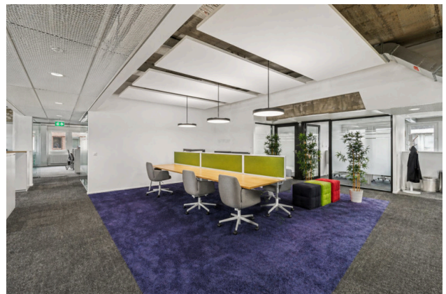
Moderne Arbeitszone mit Begegnungscharakter