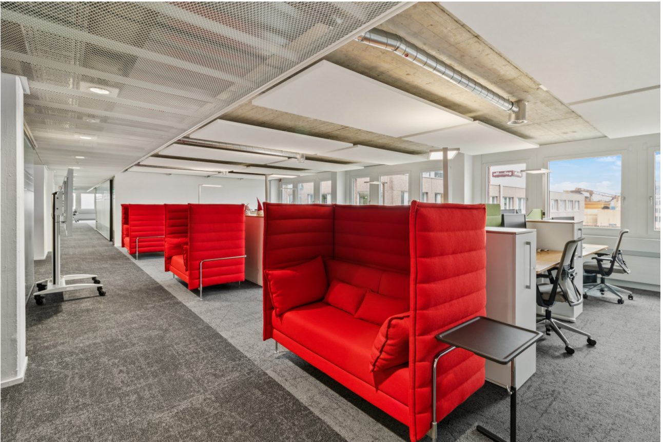
Rückzugsorte für fokussiertes Arbeiten