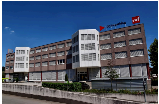
Rütistrasse 13/15 Schlieren