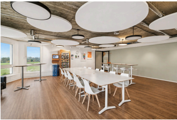
Cafeteria mit viel Tageslicht