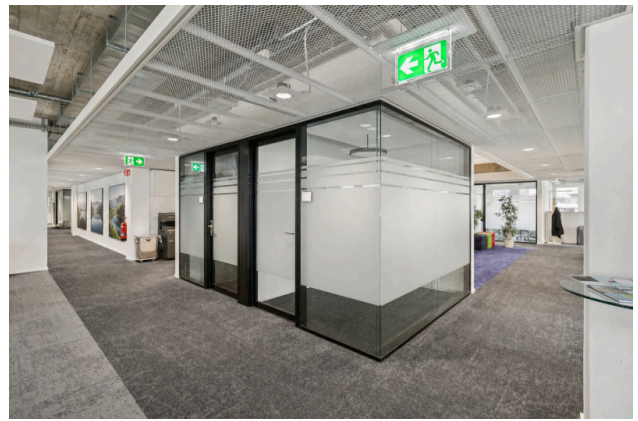
Moderne Glas-Meetingräume im Open Space