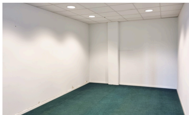
Archiv oder Serverraum