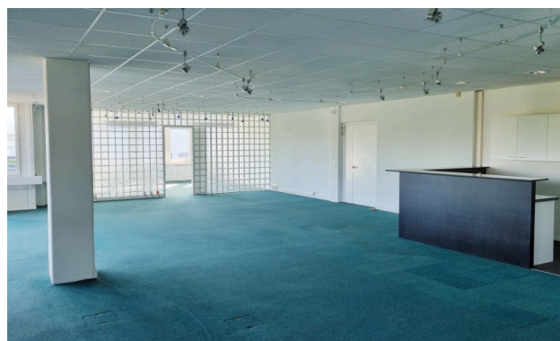
Eingangsbereich und Grossraumbüro