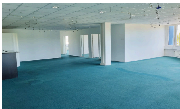
Grossraumbüro und Eingangsbereich