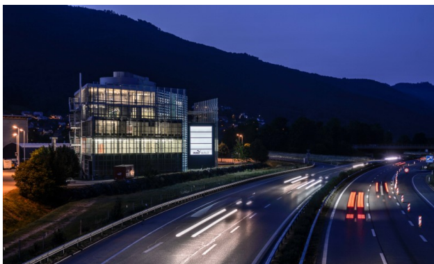
Beleuchtete Werbeträger - gute Sichtbarkeit