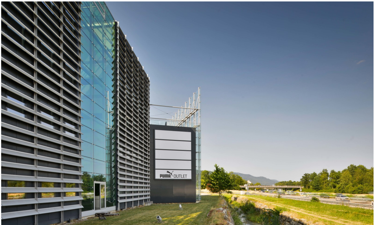
Aussenansicht Richtung Zürich