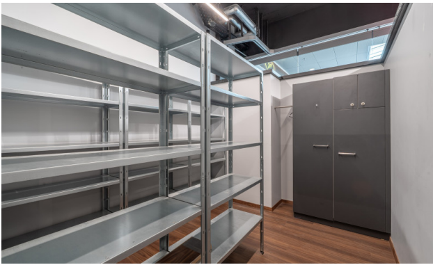
Bestehender Innenausbau - Lager