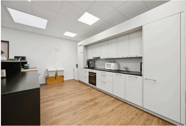
Empfangs-/ Aufenthaltszone und Küche