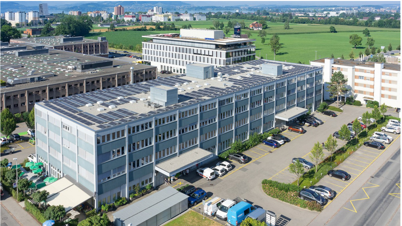
Nordansicht Oberneuhofstrasse 6/8