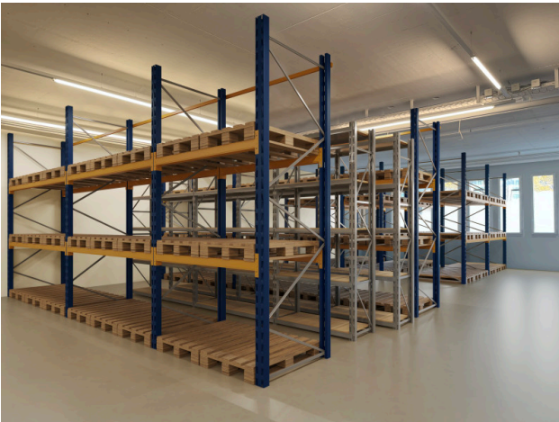
Option 1 mit Lagergestellen