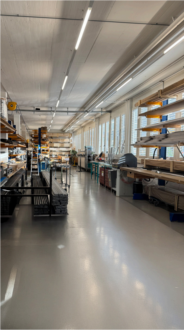
Option 3 mit Lagergestellen