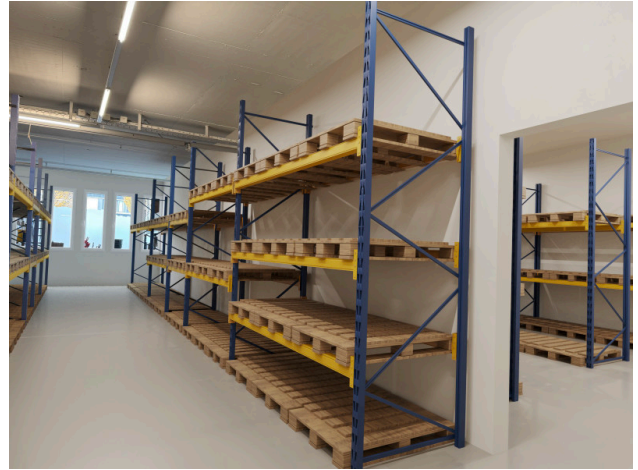
Option 2 mit Lagergestellen