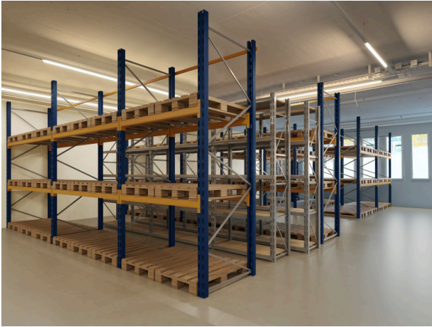
Option 1 mit Lagergestellen