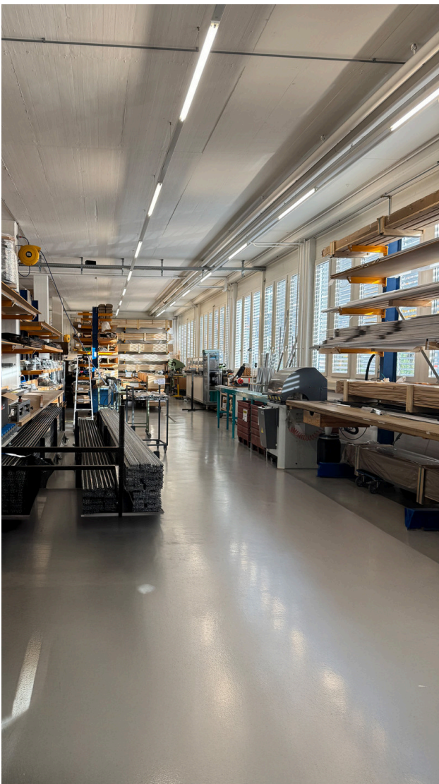
Option 3 mit Lagergestellen