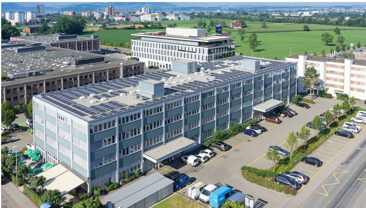
Nordansicht Oberneuhofstrasse 6/8